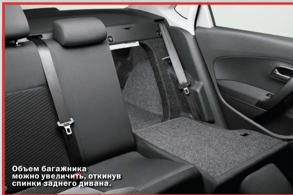
Объем багажника можно увеличить, откинув спинки заднего дивана.