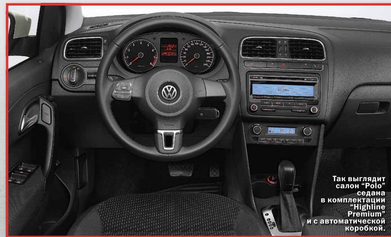
Так выглядит салон "Polo" седана в комплектации "Highline Premium" и с автоматической коробкой.

котник между передними сиденьями появился. Но есть что-то еще новое... Точно! Я заметил, что по сравнению с пятидверным "Polo" здесь передняя стойка более пологая, а потому наклон лобового стекла другой. Открываем капот. Под ним — совершенно новый 105-сильный бензиновый мотор, который может комплектоваться как пятиступенчатой "механикой", так и шестиступенчатым "типтроником". Тем самым "Volkswagen" стал первым автопроизводителем, который предложил российским клиентам столь современную автоматическую трансмиссию в данном классе автомобилей. Что касается подвески, то спереди на автомобиль устанавливается McPherson, как на хэтчбеке "Polo". За основу