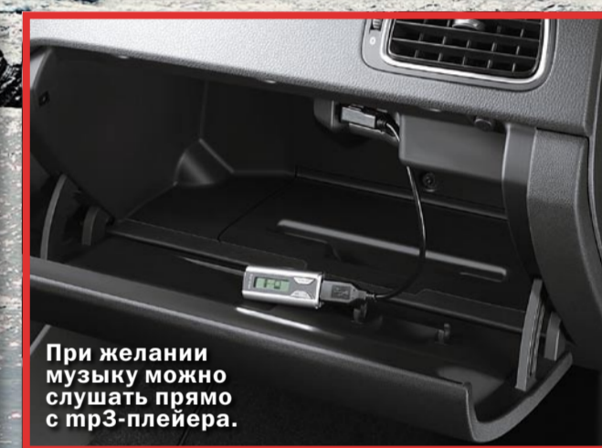
При желании музыку можно слушать прямо с mp3-плеера.