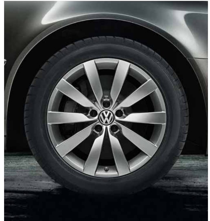
Легкосплавные диски «Experience», 8½ J x 18, шины 255/45 R 18 цвет – серебристый «Sterling».