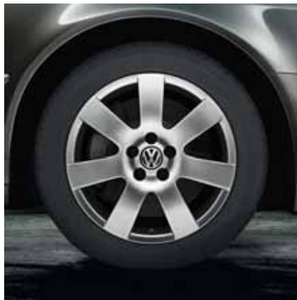
Легкосплавные диски «Innovation», 8½ J x 18, шины 255/45 R 18 цвет – серебристый «Sterling».