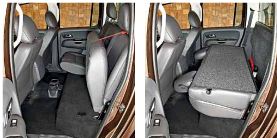
★ В просторном пятиместном салоне — масса вариантов трансформации сидений. Здесь также можно перевозить дополнительную поклажу.

оснащен системой непосредственного впрыска Common-Rail и двойным турбонаддувом, позволяющим уже при 1500 об/мин достигать максимального крутящего момента 400Нм. Еще одна очень важная характеристика — уникально низкий (около 7,6 л) средний расход топлива. На одном баке (емкостью 80 л) водитель Amarok может проехать по трассе без дозаправки более 1000 километров.